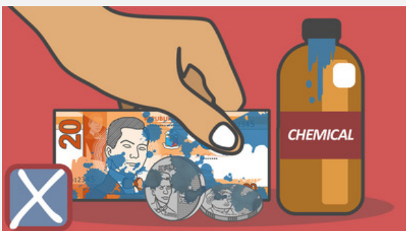
pagbabad sa mga kemikal