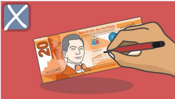
pagsulat o paglagay ng mga marka